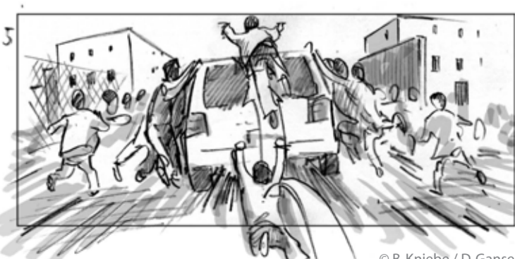
© B. Kniebe / D. Gansel